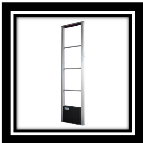
MODELO – MONO–XLD–T05A