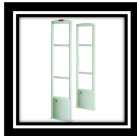
MODELO – DUPLA–XLD–T03